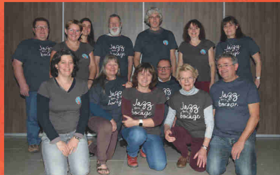
Membres du bureau 2018