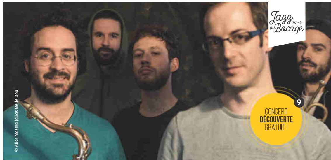
© Alice Maserà (alias Melle Dou)